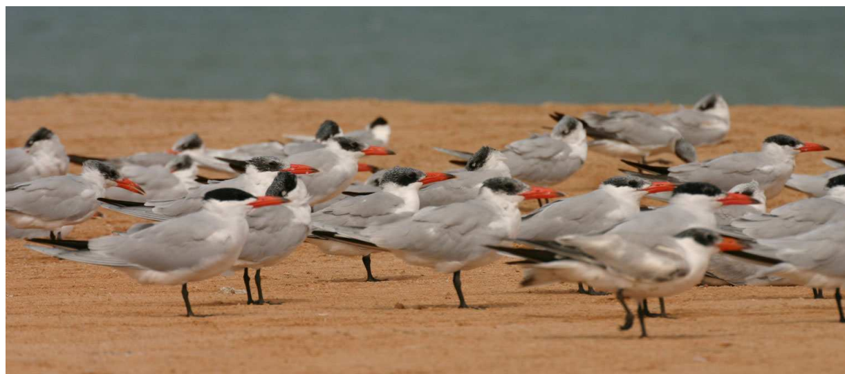
Sternes caspiennes à Dakhla (photo P. Bergier, 27 février 2008)