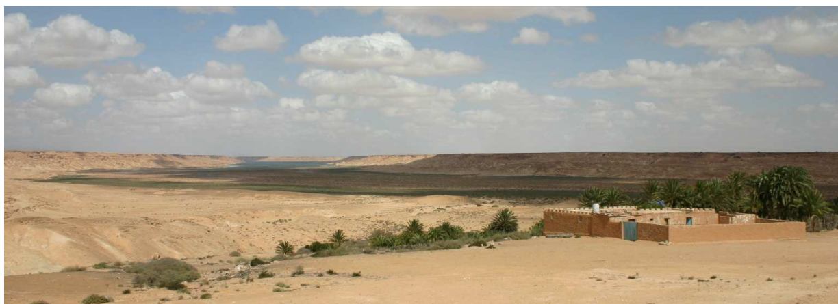
L'oasis de Lemsid (photo P. Bergier, 25 février 2008)