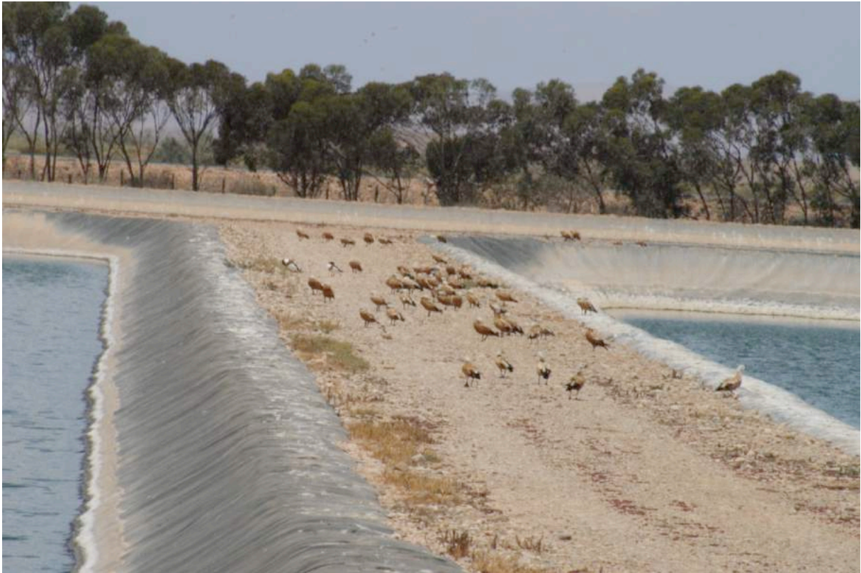
Figure 3. Tadornes casarcas sur une allée dans la STEU de Guelmim, 7 avril 2017