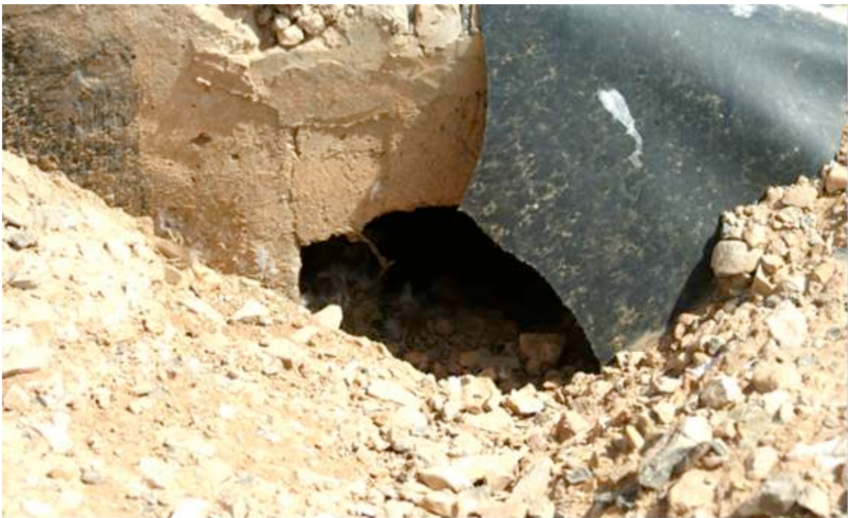
Figure 8. Cavité qui semble avoir servi de nid au Tadorne casarca dans la STEU de Guelmim