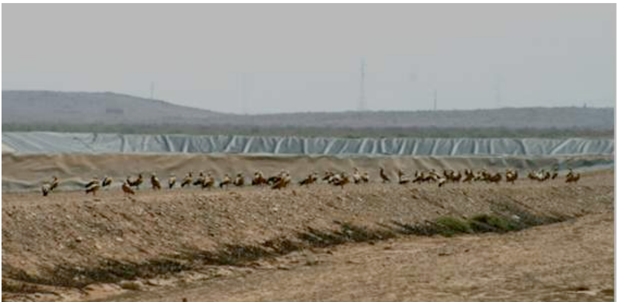
Figure 4. Tadornes casarcas en bordure du bassin C de la STEU de Guelmim, 7 avril 2017