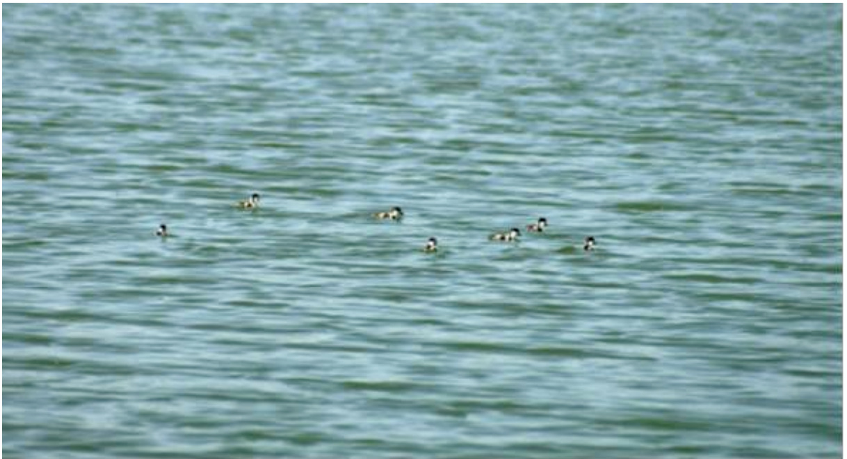
Figure 6. Canetons dans la STEU de Guelmim, 29 avril 2017