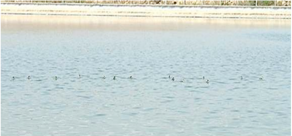
Figure 5. Crèche de 14 canetons dans la STEU de Guelmim, 7 avril 2017