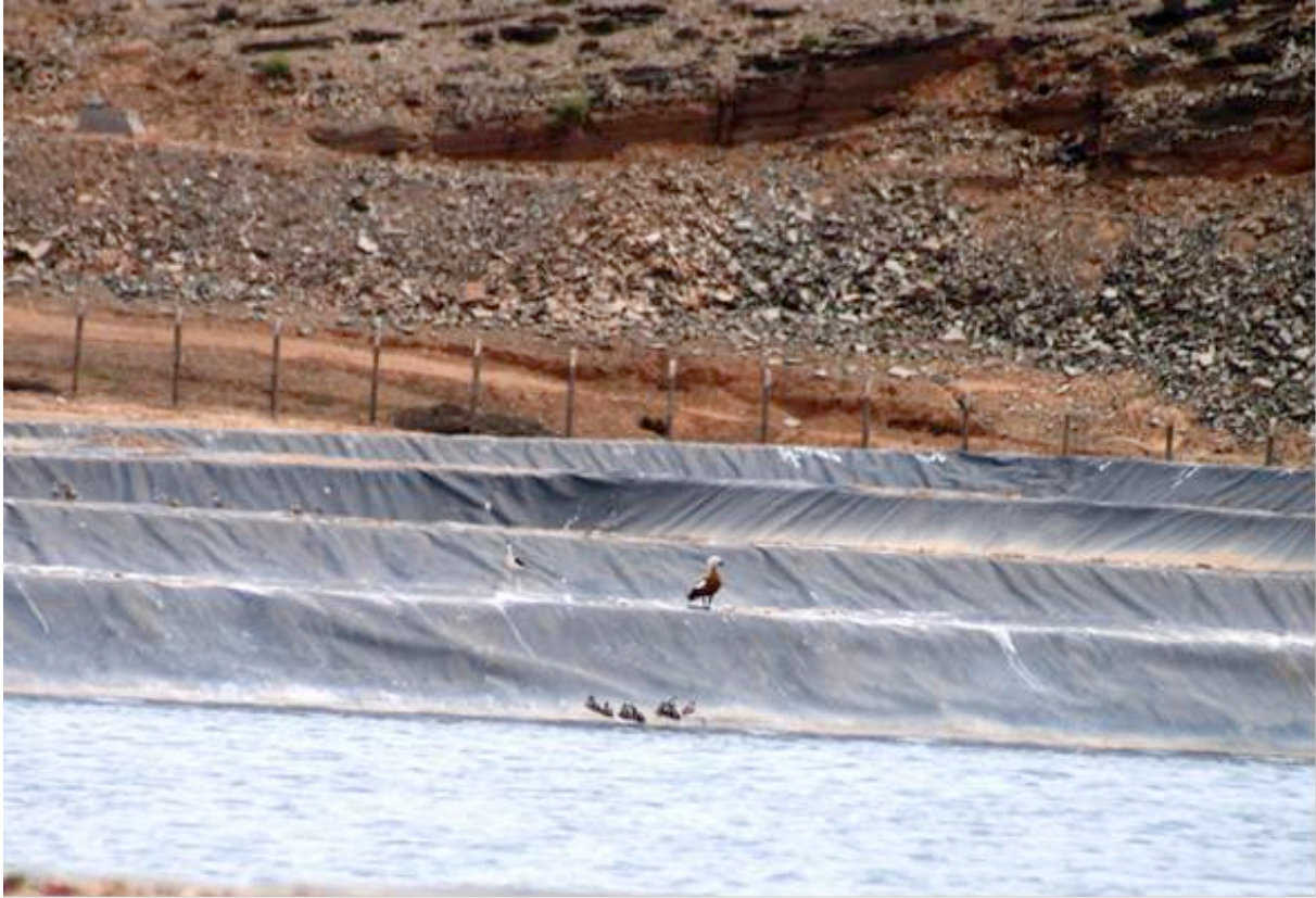
Figure 7. Tadorne casarca adulte en compagnie de huit canetons dans le bassin C la STEU de Guelmim, 29 avril 2017