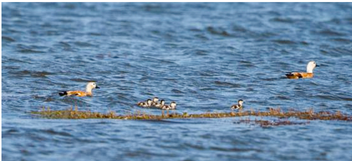
Figure 9. Couple en compagnie de cinq canetons au barrage d'Imi El Kheng, 12 juin 2017