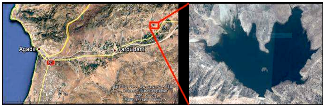
Figure 2. Localisation du barrage d'Imi El Kheng