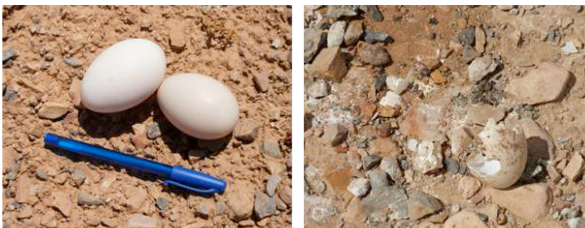
Figure 10. Œufs de Tadorne casarca trouvés en surface sur une allée de la STEU de Guelmim, 29 avril 2017