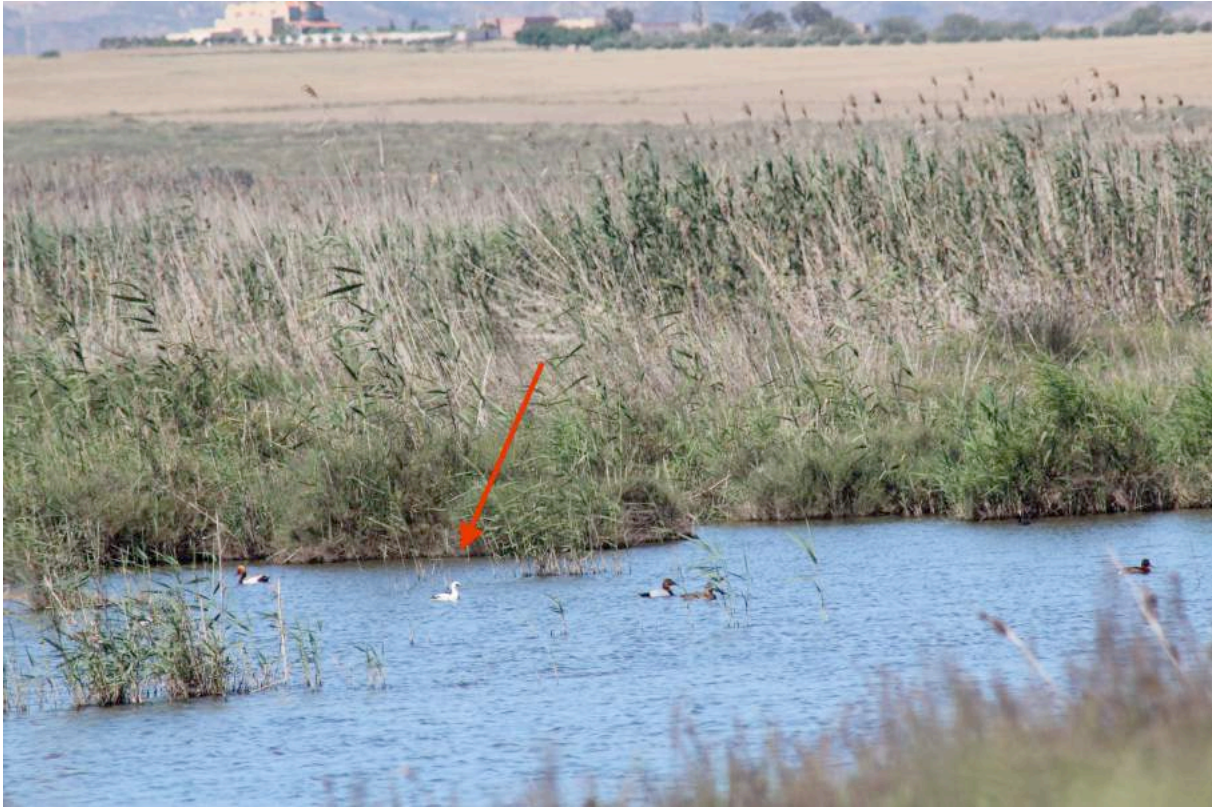
Photo 1. Vue du marais d'Aïn Chabak avec le Harle piette, 14 mai 2018