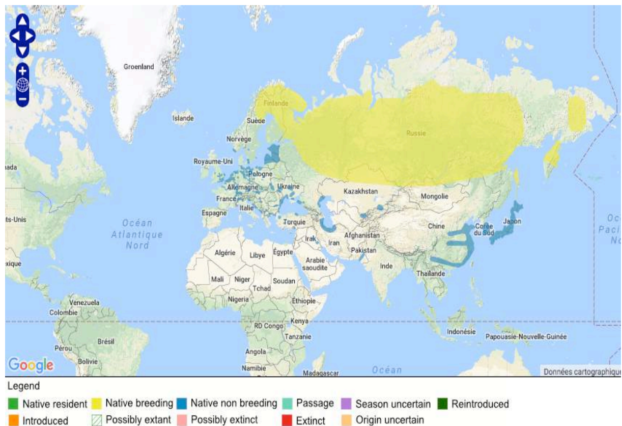
Figure 1. Zones de reproduction et d'hivernage du Harle piette Mergellus albellus (d'après Birdlife International 2018)

Le Harle piette Mergellus albellus se reproduit sur une très large zone, de la Scandinavie à l'est sibérien ; il hiverne en mer du Nord, en mer baltique, de l'Europe centrale aux mers noire et caspienne, puis au Japon, en Corée et dans l'est de la Chine.